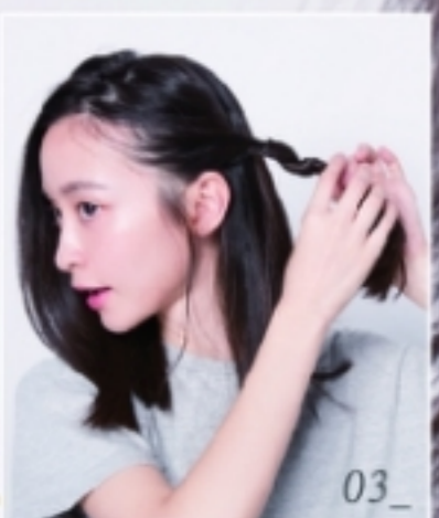
耳際留髮絲，將剛 三七分的三分區 頭髮向後旋轉