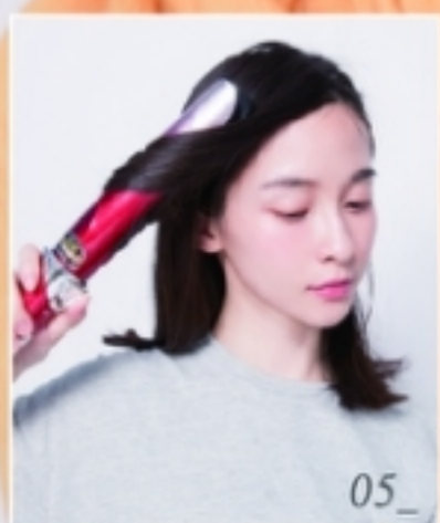
七分區和耳際 髮絲使用產品 自動上捲