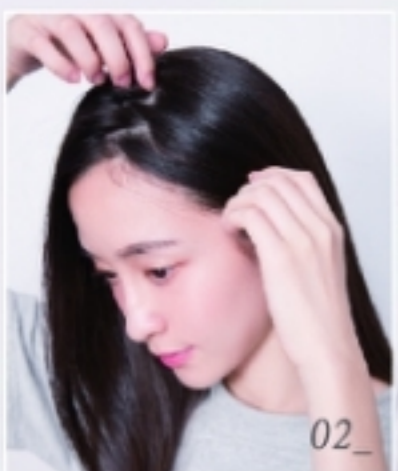
手畫鋸齒狀將 頭髮三七側分