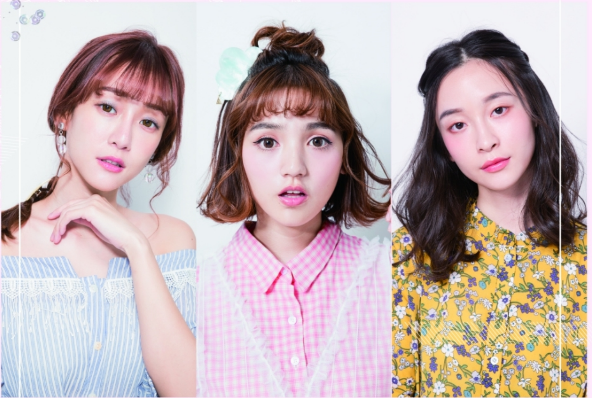
TESCOM / ITH1700TW